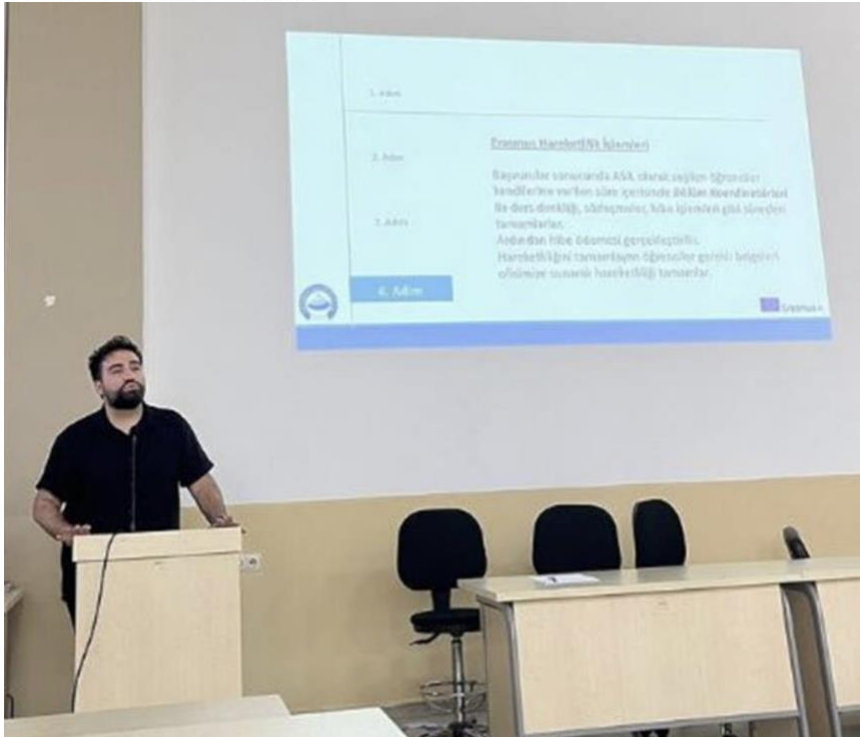
Asü Erasmus Öğrenim Hareketliliği Tanıtımı