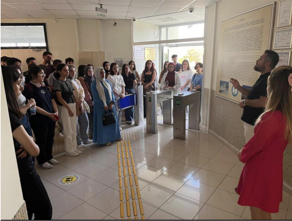
ASÜBTAM Aksaray Üniversitesi Bilimsel ve Teknolojik Uygulama ve Araştırma Merkezi