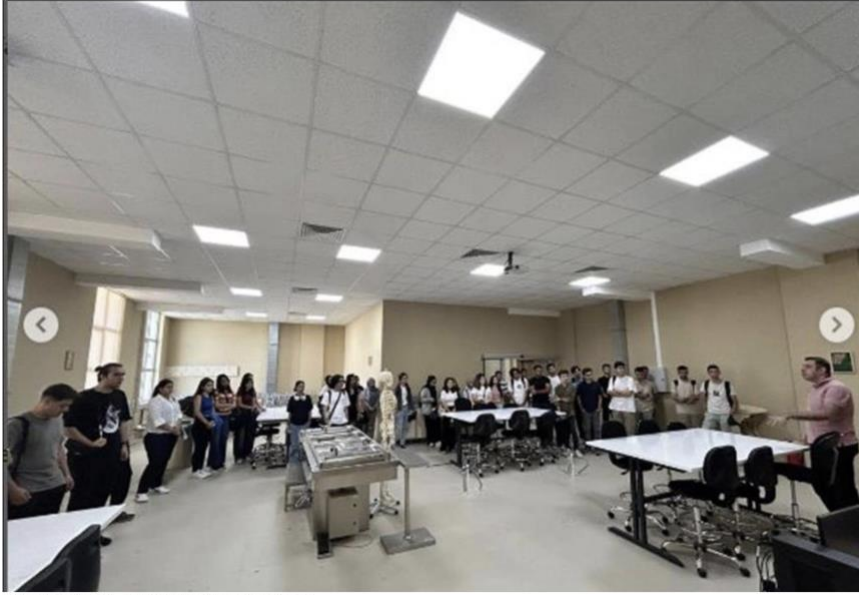
Asü Anatomi Anabilim Dalı tanıtımı