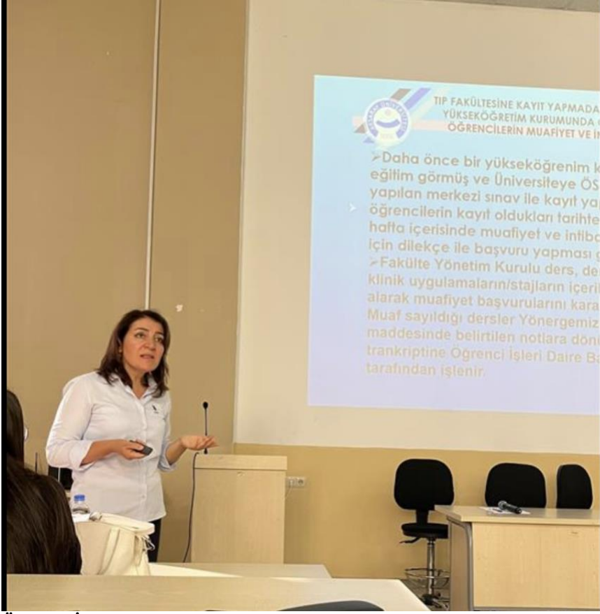
Öğrenci İşleri Daire Başkanlığı Faaliyetlerinin Tanıtımı