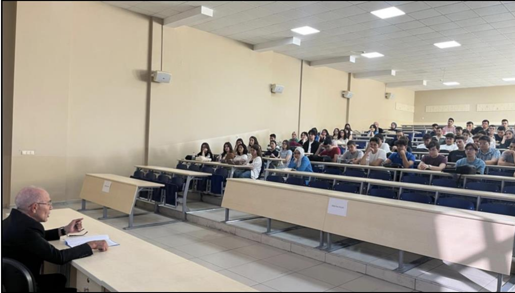
Sağlık ve Spor Kültür ve Daire Başkanlığı Faaliyetlerinin Tanıtımı